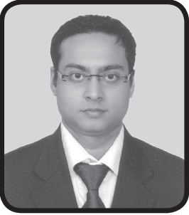
संचालक श्रीकविकुमार टिवरेवाला संस्थापक समूह